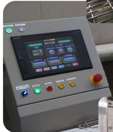
タッチパネル式操作盤

洗浄仕様を考慮した装備品を充実。 多種多様なオプションから各生産工場 に合わせたカスタマイズが可能です。 ※オプションは別途追加見積