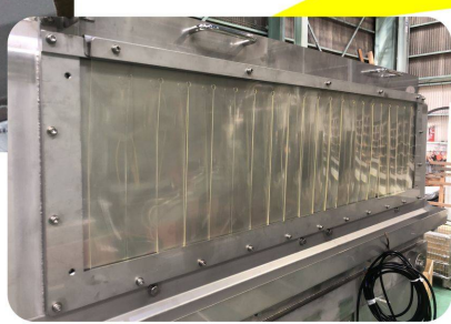
搬入口シャッター

洗浄仕様を考慮した装備品を充実。 多種多様なオプションから各生産工場 に合わせたカスタマイズが可能です。 ※オプションは別途追加見積